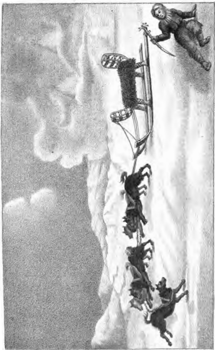
Взга на собакаръ